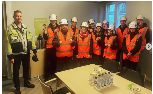
Kemian työkurssin opiskelijat tutustuivat marraskuussa 2022 Kotkamillsin tehtaaseen.