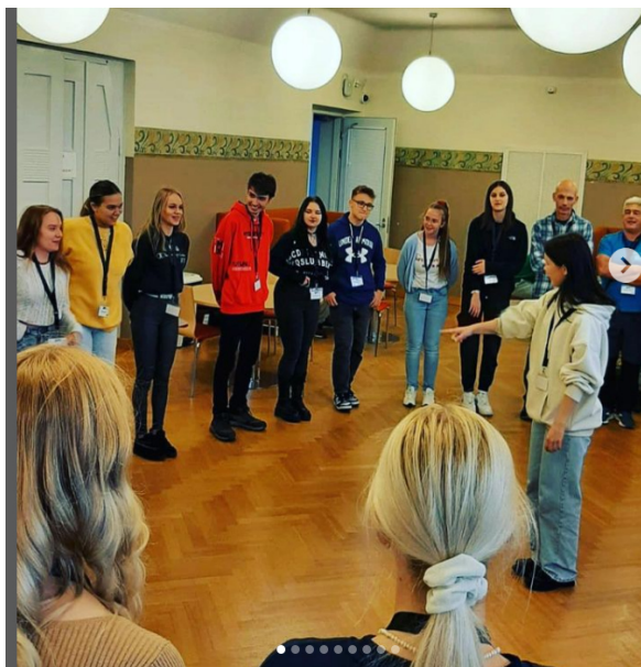
Erasmus-hankkeen opiskelijoita ja opettajia Lyseon Arcus-talolla.

Viisi ranskalaisen Lycée Professionnel Henri Sainte Claire Deville -koulun opettajaa seurasi Lyseon toimintaa Erasmus job-shadowing -hankkeen