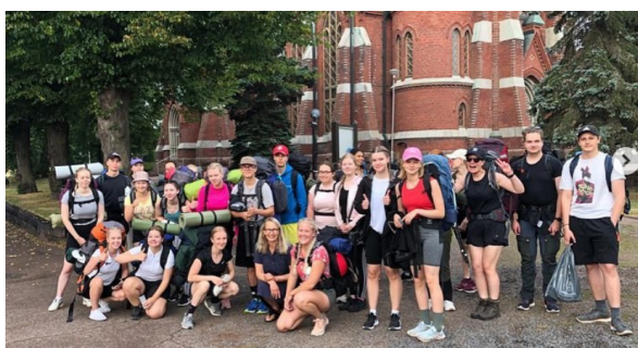
Lyseon retkikurssi suuntasi tänäkin vuonna Repovedelle huikkeassa säässä!

Mielenterveyttä tuettiin jo alkusyksystä 24.8. Rauhan puu -tapahtumassa. Lokakuun 7. päivä toisen luokan oppilaat seurasivat Teatteri Taiminen esitystä Knock out. Tämä kaksikielinen esitys kertoo nuorista, joiden on vaikea löytää paikkaansa monimutkaisessa ja vaativassa yhteiskunnassa.