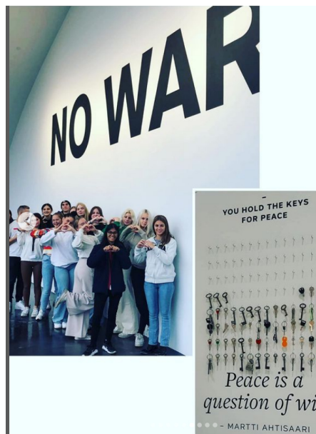
Erasmus-opiskelijat olivat ajankohtaisten ongelmien äärellä hankkeessaan.