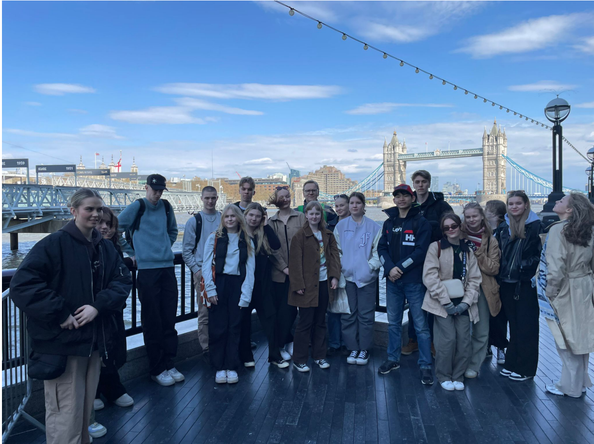
Lontoon Tower bridge ei ainakaan ole sortumassa. Studies in English -opiskelijat Thamesin rannalla.

Toisen luokan opiskelijoiden Studies in English -ryhmä teki 20.–23.4. opintomatkan Englantiin. Ryhmä rahoitti matkaansa myymällä Kakkutukun tuotteita pitkin lukuvuotta.