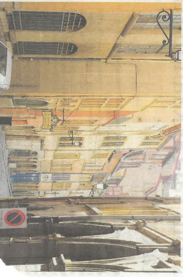
Pieni katu Vanhassa Lyonissa.