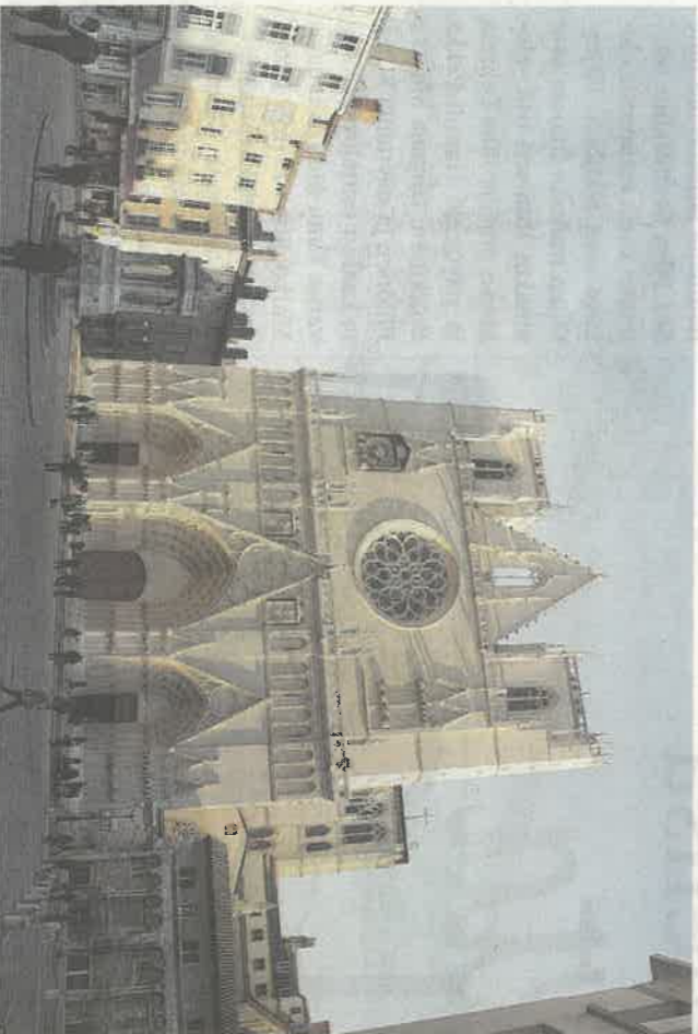
Saint Jeanin katedraali.