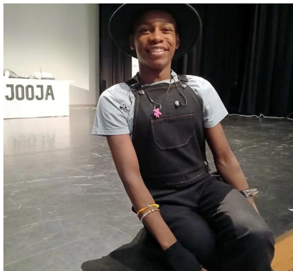
Artisti JOOJA 30.5. juhlistamassa vappua Muuramen lukiossa