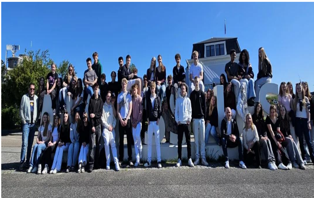
Ensimmäisenä Hollannin vaihtopäivänä