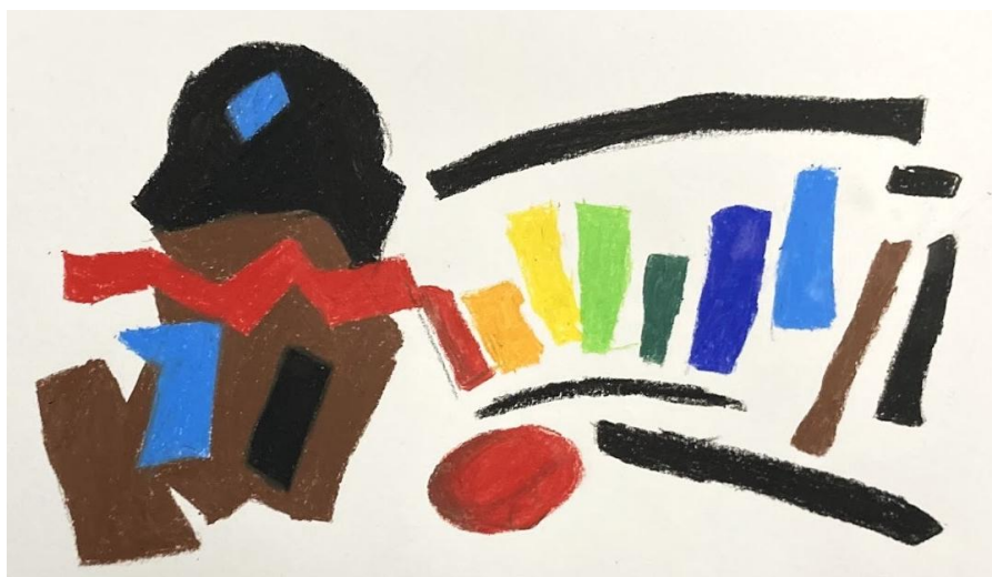
teos: Allu Pekkarinen