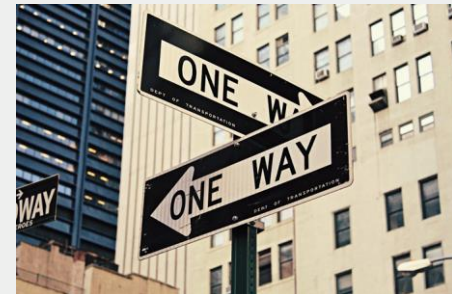
Kuva: Brendon Church on Unsplash