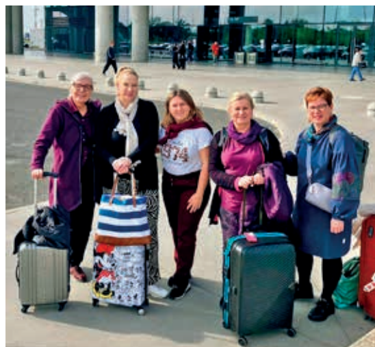
Otsolan edustajia Erasmus+-matkalla Kroatiaassa

Edessänne olevassa Otsolan kansalaisopiston syyslukukauden 2026 opetusohjelmassa on tarjolla tietoa, taitoja ja toimintaa Porissa, Eurajoella, Nakkilassa ja verkossa yli 460:n opintoryhmän, kurssin ja luennon verran. Totuttuun tapaan joukossa on niin vakiintuneita toimintoja kuin runsain määrin uusiakin aiheita – ukrainan alkeista enneagrammeihin, dekkarien kirjoittamisesta kimaltaviin peilimosaiikkeihin, viinikulttuurista minijoogareitittein, seniorisirkuksesta pyhiin järviin ja uhrilähteisiin.