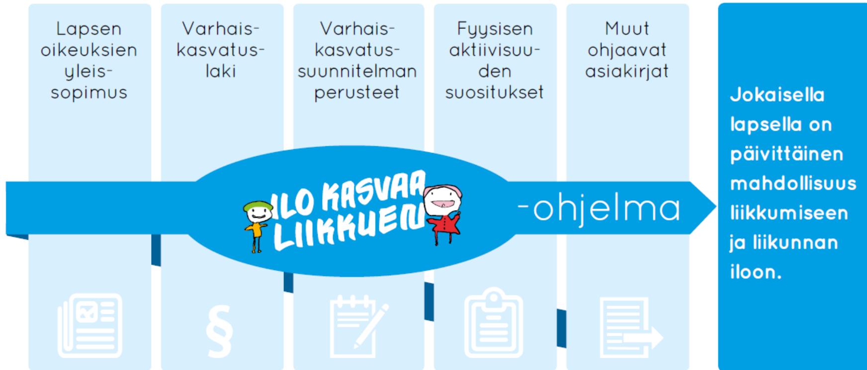
Kuva 4 Ohjaavien asiakirjojen, Ilo kasvaa liikkuen -ohjelman ja fyysisen aktiivisuuden suositusten yhteys.

(Ilo kasvaa liikkuen- ohjelma- asiakirja, Varhaiskasvatuksen liikumis- ja hyvinvointiohjelma, Liikunnan ja kansanterveyden julkaisuja 357)