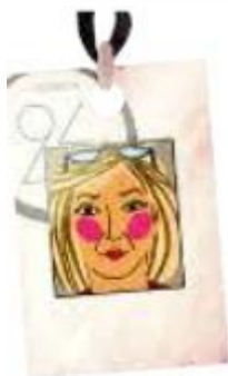
1 Paloma periodista, Madrid (España)

argentino, -a español, -a colombiano, -a mexicano, -a chileno, -a peruano, -a ecuatoriano, -a finlandés, -a