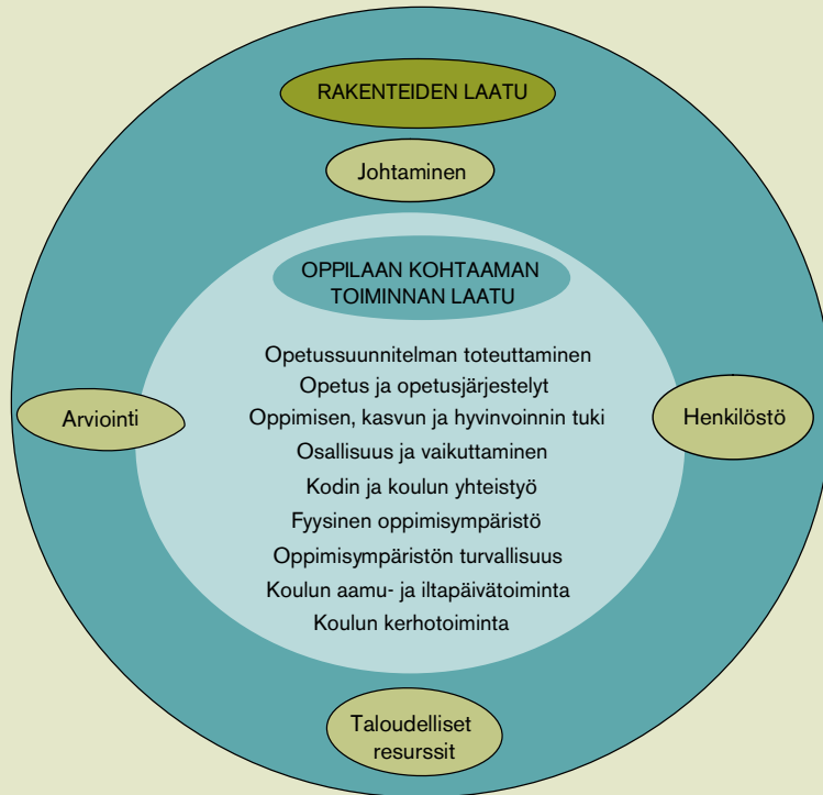
Kuvio 3. Perusopetuksen laatukriteereiden viitekehys.