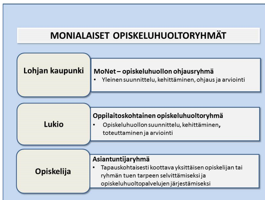
Kuva 4. Monialaiset opiskeluhooltoryhmät

Lohjan kaupunki on asettanut opiskeluhoollon ohjausryhmän (MoNet) ja määrittää, keitä oppilaitoskohtaiseen opiskeluhooltoryhmään kuuluu. Yksittäistä opiskelijaa koskevat asiat käsitellään tapauskohtaisesti koottavissa asiantuntijaryhmissä, joiden kokoonpano muotoutuu tilanteen mukaan. Kaikki opiskeluhooltoryhmät ovat monialaisia siten, että ryhmässä on mukana opetushenkilöstöä, opiskeluterveydenhuoltoa sekä psykologi- ja kuraattoripalveluja edustavia jäseniä. Jokaisella kolmella ryhmällä on omat tehtävänsä ja niiden perusteella määräytyvä kokoonpano.