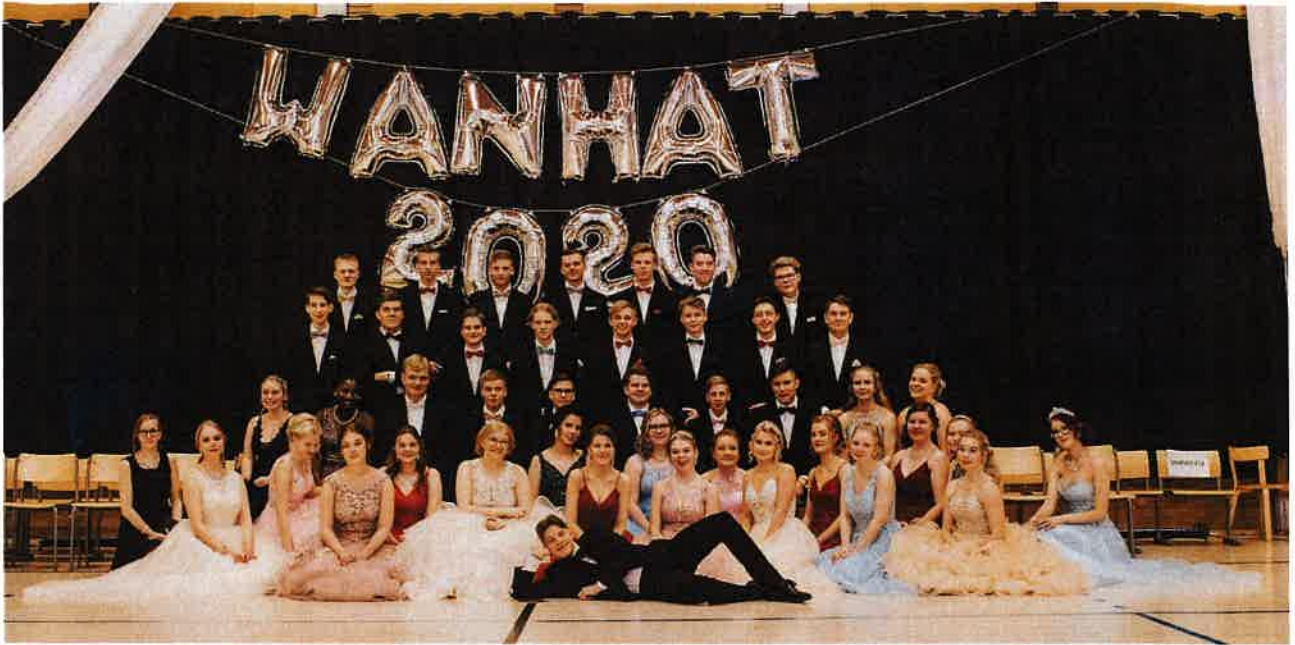
Vanhojen päivä 14.2.2020