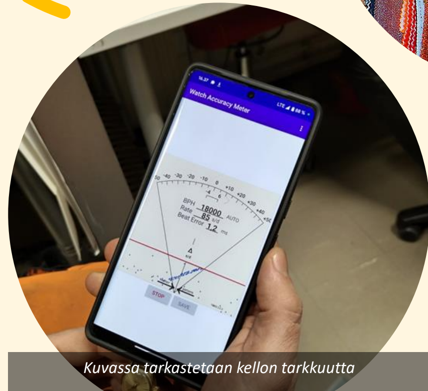
Kuvassa tarkastetaan kellon tarkkuutta