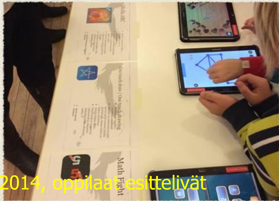
Veromäen Apps messut 27.11.2014, oppilaat esittelivät opettajille suosikki sovelluksensa.