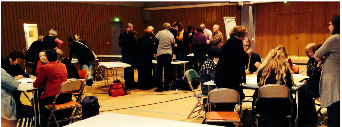
Ohjausta kehitettiin 27.11.2013 Sinut on tunnistettu - Koulutuspolitiikan mestari 2013 -seminaarissa.

Elinikäinen ohjaus voi toteutua laadukkaasti vain verkostomaisella yhteistyöllä.