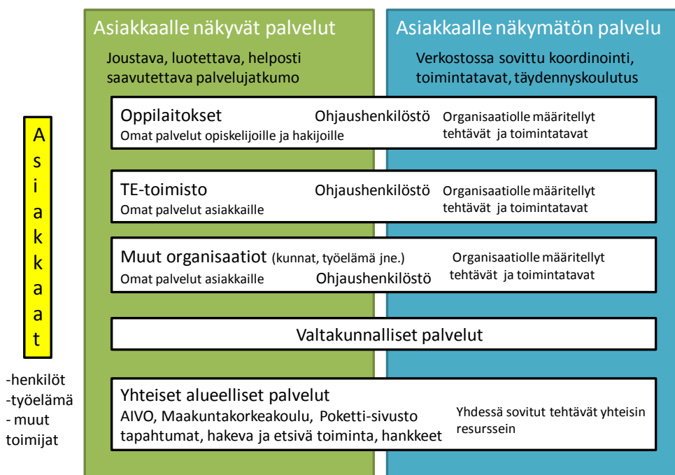
Kuvio 2. Alueen TNO-palvelut muodostuvat verkoston organisaatioiden omista, yhteisistä ja valtakunnallisista palveluista

Verkosto kehittää omaa osaamistaan, ja ohjaushenkilöstöllä ja verkostolla olevaa tietoa hyödynnetään asiakaspalvelussa, toimintamallien ja täydennyskoulutusten suunnittelussa. Kuviossa 3. on kuvattu tätä kokonaisuutta. (Aikuisten tieto-, neuvonta- ja ohjauspalvelut Keski-Suomessa vuoteen 2020, mukailten.)