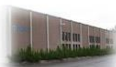
Asentajantie 8-10, Ratasniitty