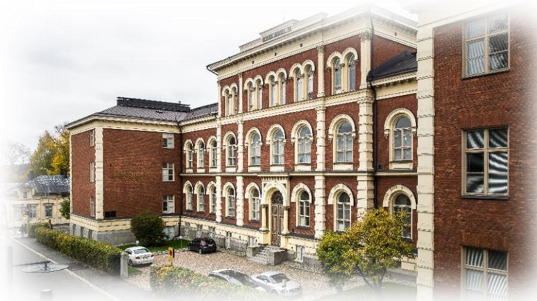
Hämeenlinnan lyseon lukio