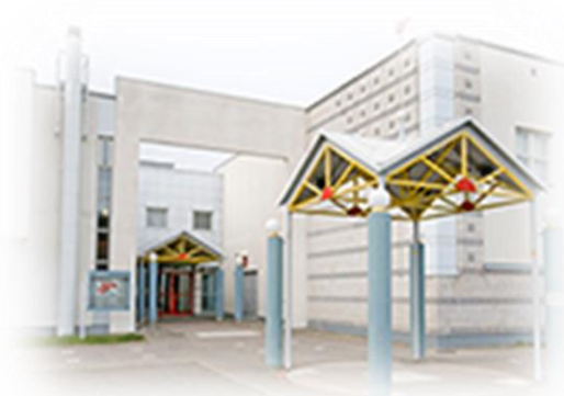
A-rakennus Hattelmalantie 8