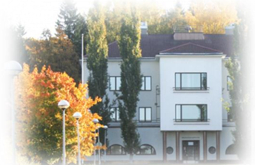
K-rakennus Hattelmalantie 25