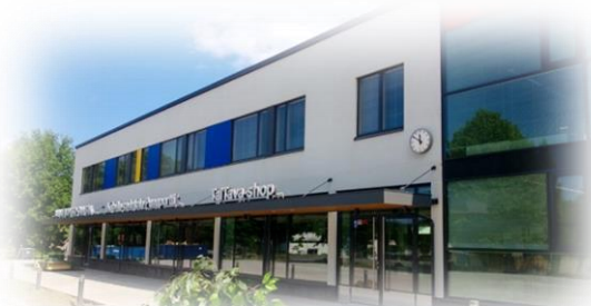
I-rakennus Hattelmalantie 25