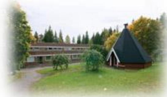
Turenki, Koljalantie 7