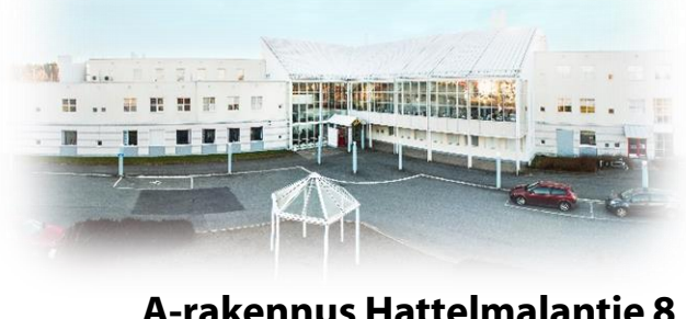
A-rakennus Hattelmalantie 8