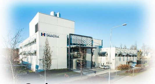
G-rakennus Hattelmalantie 6