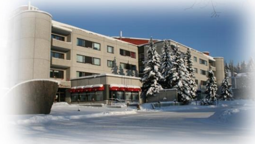
P-rakennus Hattelmalantie 25, asuntola