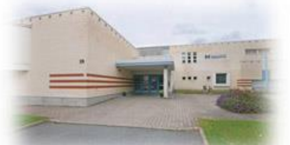
J-rakennus Jaakonkatu 28