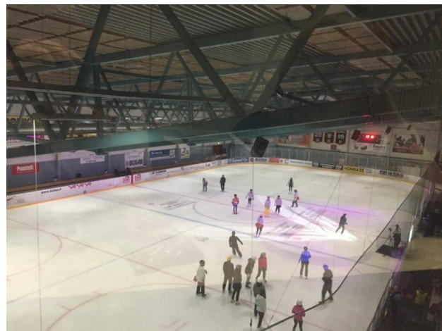
Kuvassa Järvenpään jäähalli

Keski-Uudenmaan Ohjaamo järjesti melkoisen tempauksen Järvenpään Jäähallissa Ohjaamo On Ice-tapahtumassa 17.1.2018! Duudsonien Jarppi haastoi päättäjiä nyrkkeilykehässä ja alueen Ohjaamolaiset kisailivat jäällä. Paikalla oli 800 alueen nuorta ja tilaisuuden päätti viittomakielinen räppäri Signmark muistuttamalla, että unelmista kannattaa pitää kiinni viimeisen asti.