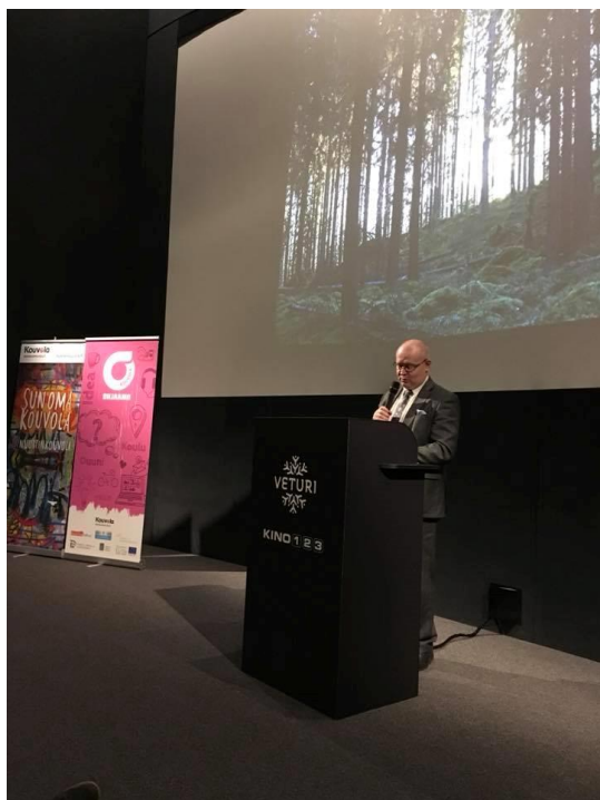
Kuva: työministeri Lindström, Kouvola Ohjaamo Facebook

Kouvolassa 12.1.2018 pidetyssä tilaisuudessa oli Kymenlaakson oma poika työministeri Jari Lindström paikalla. Ministeri kiitti Kouvolan Ohjaamoa erityisesti hyvästä työnantajayhteistyöstä ja rohkeista kokeiluista.