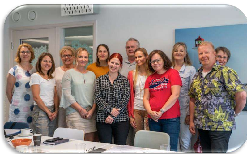
Espoon yrittäjäpilotin osallistujat.

Malli on aktiivinen, pienin askelein parempaan arjen ja uranhallintaan tähtäävä oppimisprosessi. Tyypillisiä teemoja ovat koulutuksen puute tai passiivisuus koulutukseen hakutumisessa, työttömyys, näköalattomuus urasuunnittelussa, alhainen työhyvinvointi tai terveysongelmat, taloudelliset haasteet ja passiivinen osallistuminen yhteiskunnallisiin asioihin.