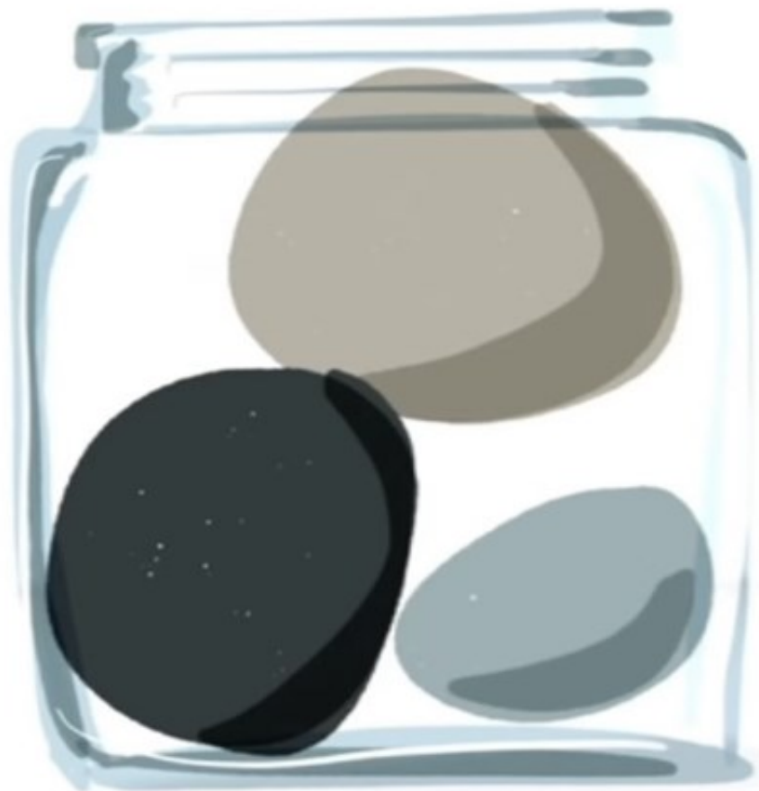
OLD SCHOOL CREDENTIALS