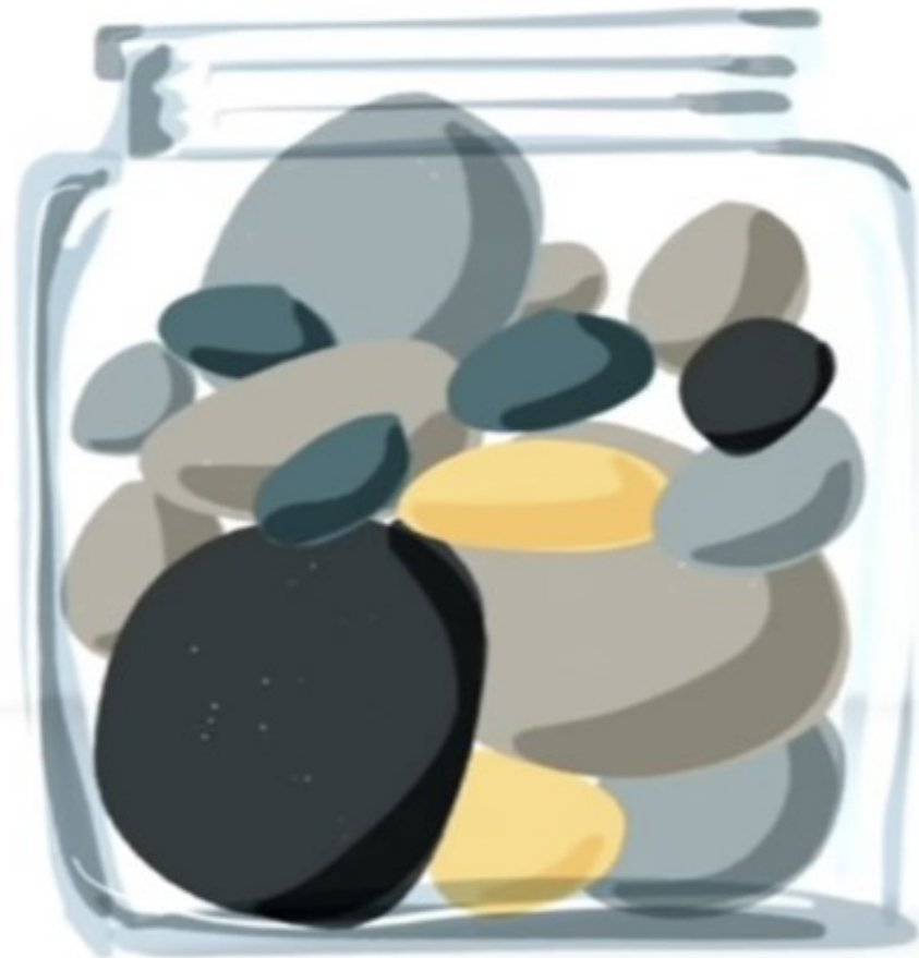
NEW SCHOOL CREDENTIALS