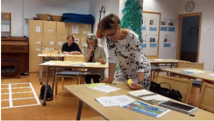
Kuvissa osallistujia Pieksämäen ISO ELO -kokouksesta 16.8.2016