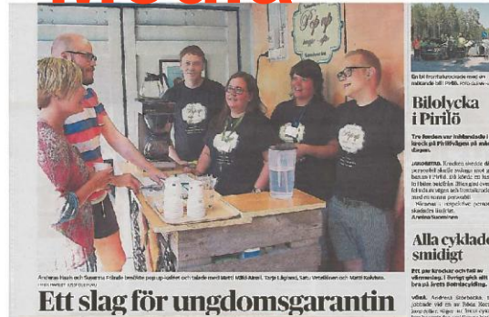
Ett slag för ungdomsgarantin