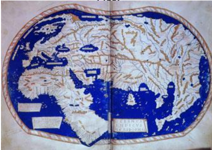
Martelluksen maailmankartta vuodelta 1489.