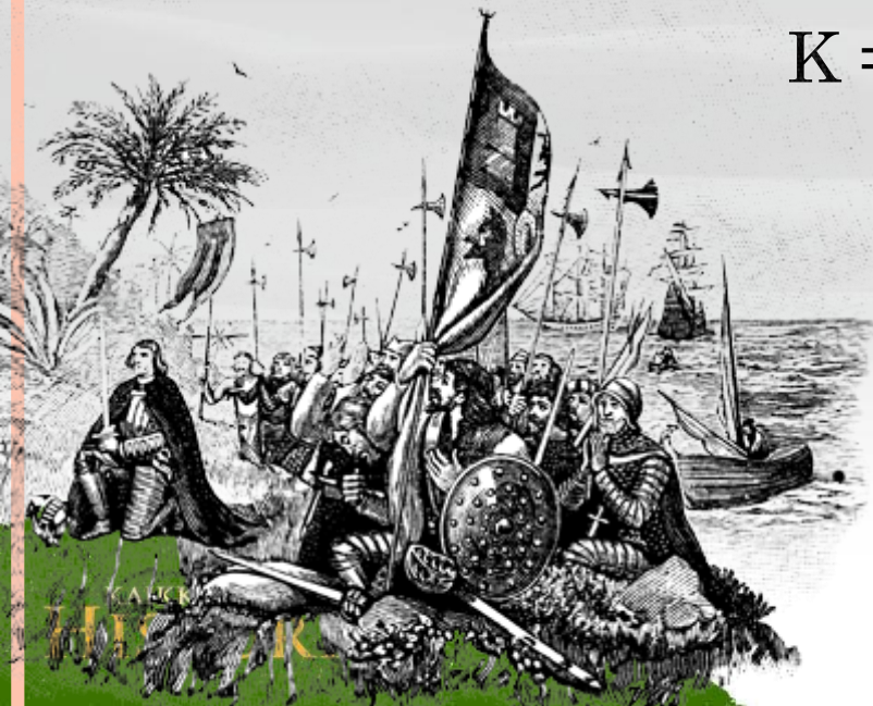
Kolumbus saapuu Amerikkaan. Piirros vuodelta 1904.