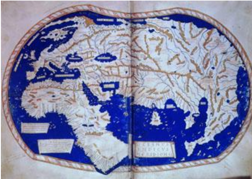
Henricus Martelluksen piirtämä maailmankartta vuodelta 1489.

Mistä tiedot tämän ajan karttoihin saatiin?