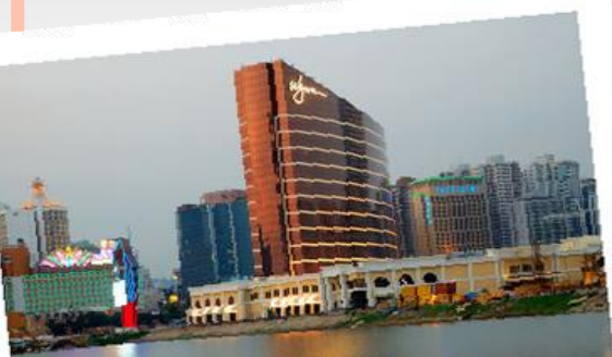
Kasinoistaan tunnettu Makao palautui Portugalilta Kiinalle vuonna 1999, yli 400 siirtomaavuoden jälkeen.