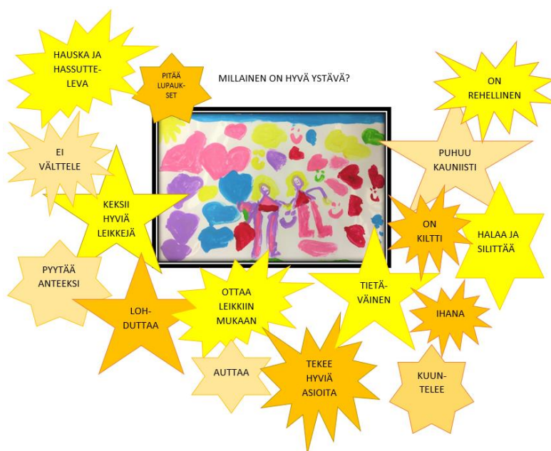
Forsssan seudun eskarilaisten ajatuksia ystävydestä.

Opiskeluhuollon suunnitelman laatimiseen on osallistettu lapsia, huoltajia, varhaiskasvatuksen henkilöstöä sekä opiskeluhuollon toimijoita mm. moniammatillisissa keskusteluissa sekä lasten kanssa esiopetuksessa tehdyissä ystävyteen ja esiopetusyhteisöön liittyvissä projekteissa ja keskusteluissa.