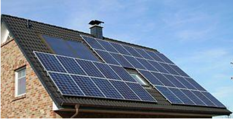
Aurinkovoima on uusiutuva energianlähde.