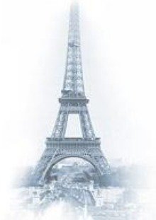
Kuva 3. Vuonna 1889 valmistunut Eiffel-torni on Ranskan kuuluisin nähtävyys.

Kuvat sijoitetaan sopiviin paikkoihin tekstin lomaan. Kuvat numeroidaan niin, että tutkielman ensimmäinen kuva on kuva 1 , seuraava kuva 2 jne. Kuville laaditaan kuvateksti, joka sijoitetaan mieluiten kuvan alle. LibreOfficella kuvatekstin saa kuvan alle napauttamalla kuvan päällä hiiren oikeaa painiketta ja valitsemalla "Kuvaotsikko". Jos pienennät kuvan kokoa, tee se vetämällä hiirellä kuvan kulmasta .