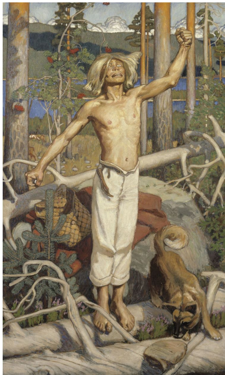
Akseli Gallen-Kallela, Kullervon kirous