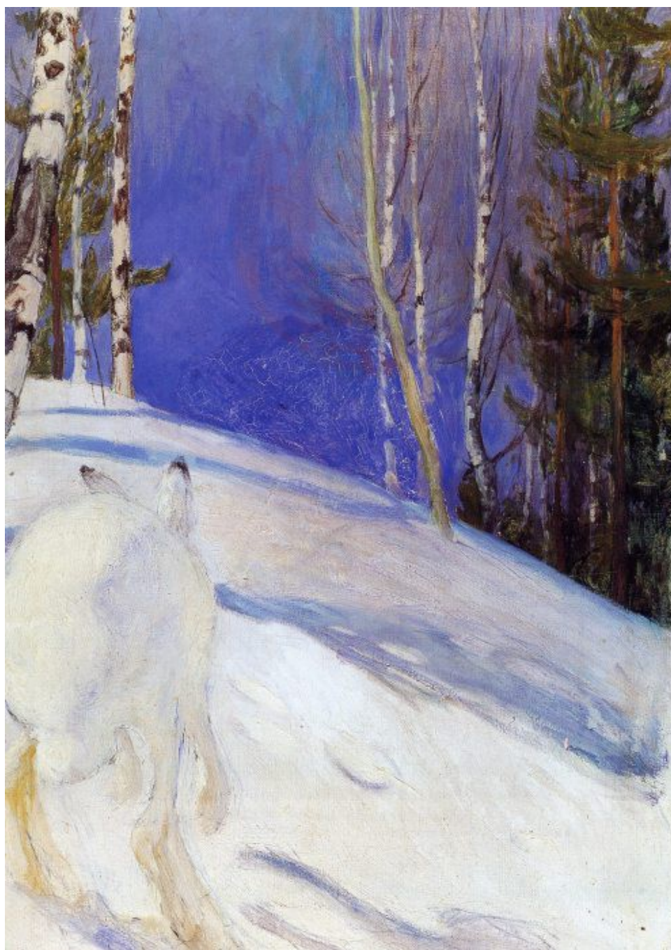
Pekka Halonen Jänis lumessa