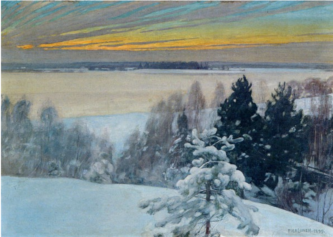
Pekka Halonen Talvinen iltarusko