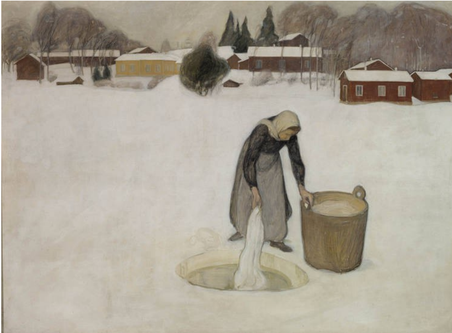
Pekka Halonen, Pyykinpesua jäällä