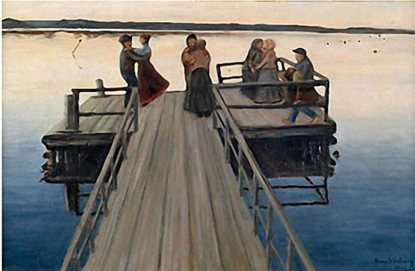
Hugo Simberg - "Laituritanssit (Winger Dance)", 1903 - Oil on canvas Image courtesy of the Didrichsen Art Museum, on view until 28th August.