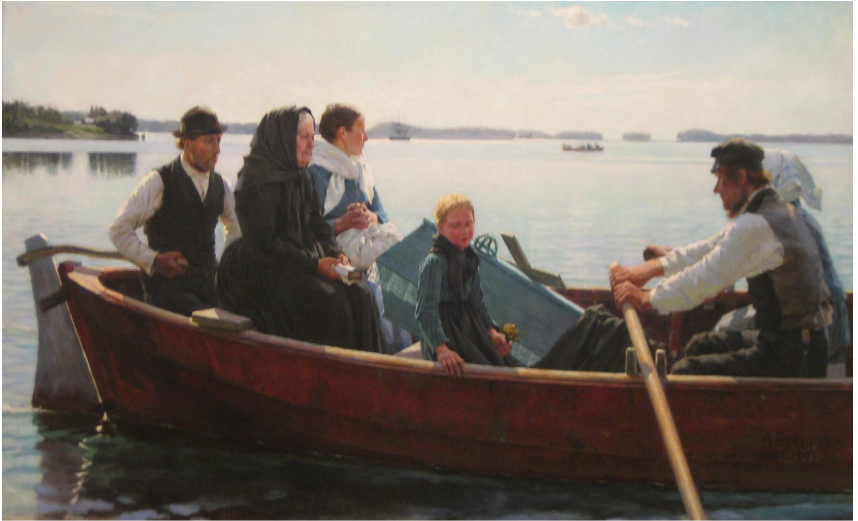
Albert Edelfelt Lapsen ruumissaatto