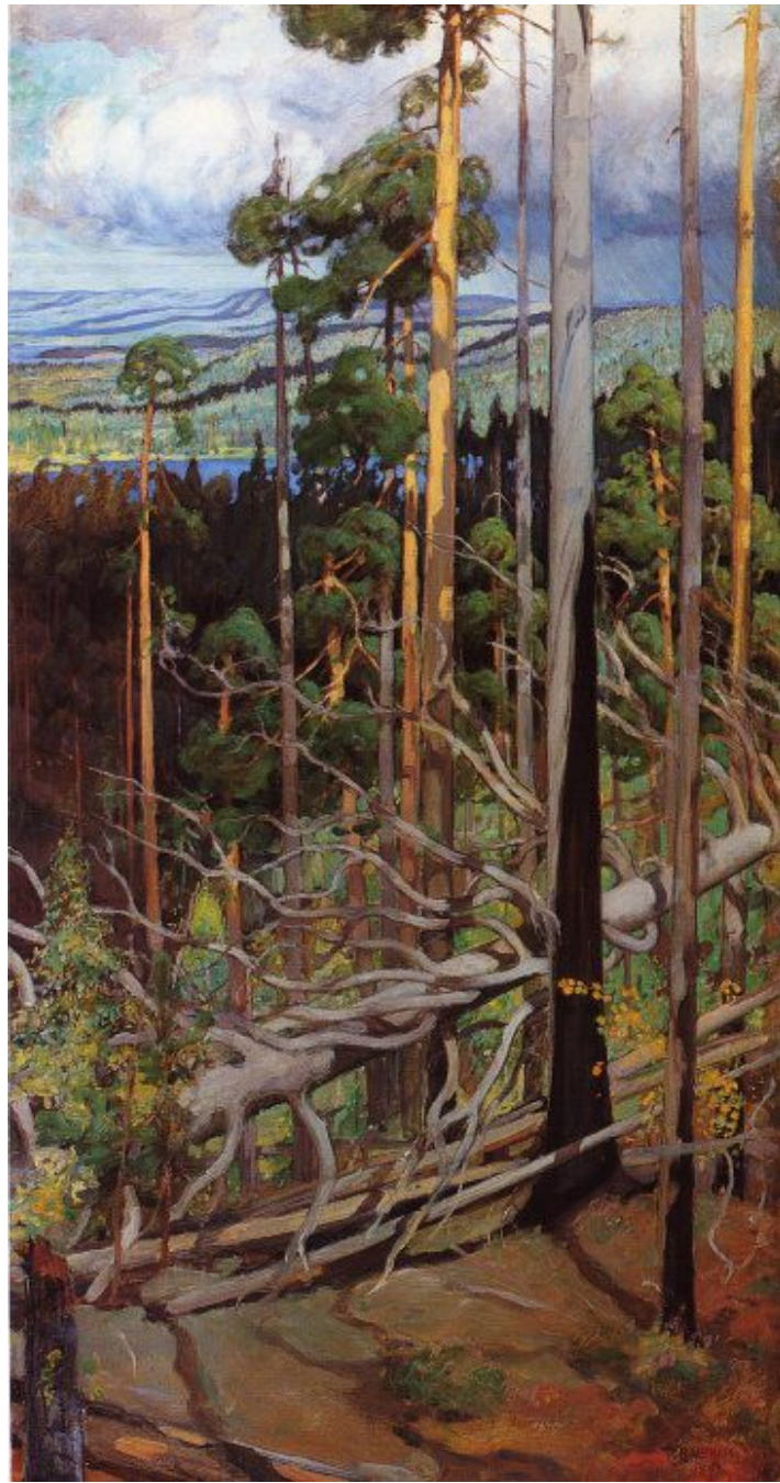
Pekka Halonen Erämaa