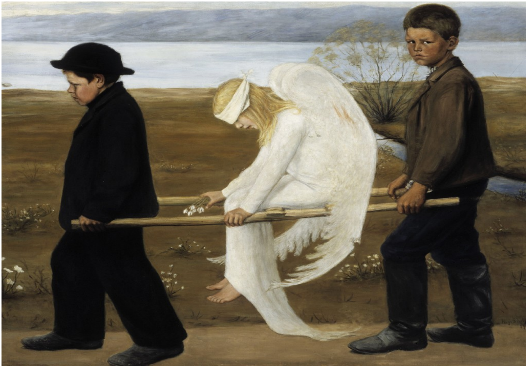
Hugo Simberg, Haavoittunut enkeli