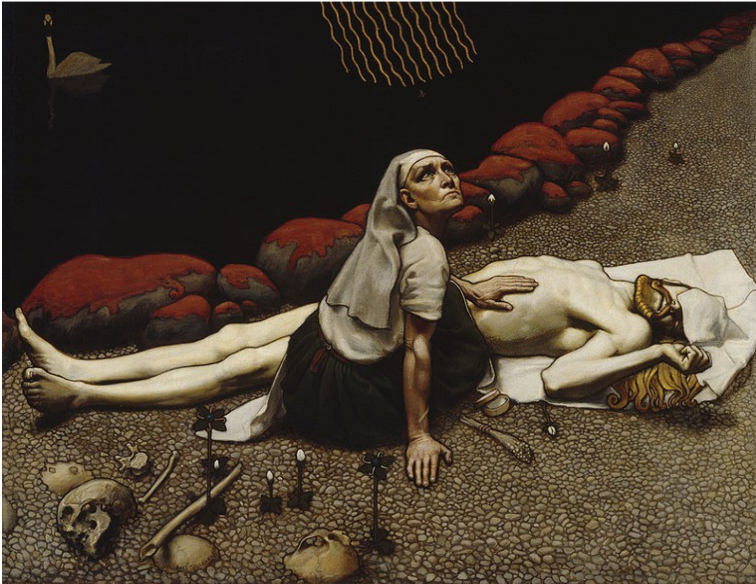
Akseli Gallen-Kallela Lemminkäisen äiti