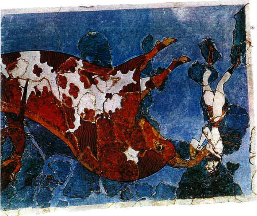
▽ Tässä Knossoksen palatsin seinämaalauksessa akrobaatti hyppäävät hyökkäävänsä härän selän yli. Tapa liittyi luultavasti uskonnollisiin menoihin. Härät olivat vahvimpia tunnettuja eläimiä, ja ne liittyivät monien muinaisten kansojen uskomuksiin.