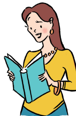
διαβάζω ένα βιβλίο