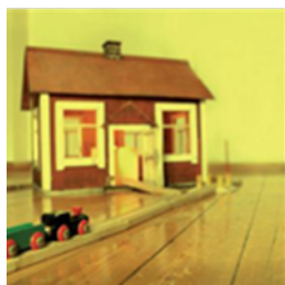
Arkea Suomessa -sarja 1 Opastusta asumiseen