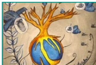
Vertaisryhmätoiminnan opas (myös selkokielisenä)