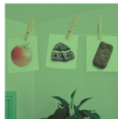
Arkea Suomessa -sarja 2 Vinkkejä pukeutumiseen ja ruokavalioon