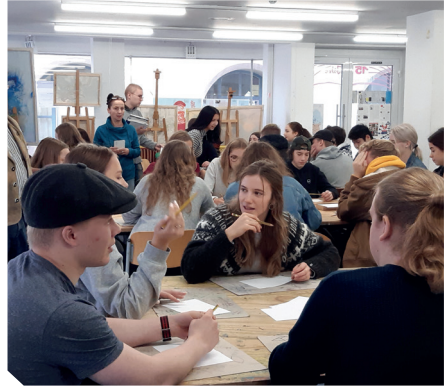
Ryhmätyön toteutustavan mietintää ja alla työn purkua taidekoulussa

massa sertifioidussa koulussa voi opiskella piirtämistä, maalausta, graafista työskentelyä ja kolmiulotteista muotoilua. Koulu tekee paljon yhteistyötä Leutkirchin koulujen kanssa. Me teimme ryhminä erilaisia harjoituksia kuvien avulla, esim. ”rikkinäistä puhelinta”.