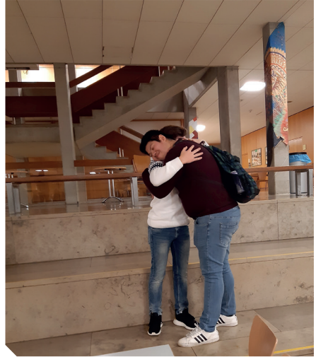
Duka ja Marlon hyvästelevät