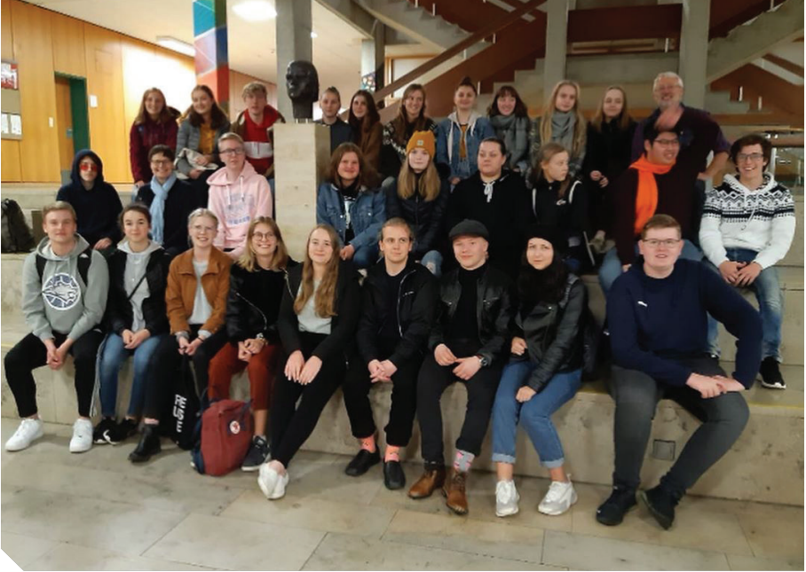
Ryhmäkuvaa viimeiseltä illalta. Kuvassa mukana Askolan lukiolaiset sekä isäntinämme toimineet saksalaiset opiskelijat ja opettajat

Saksan opiskelijoitamme vieraili marraskuussa Geschwister-Scholl Schulesa Leutkirchissä