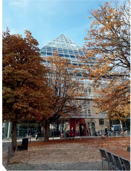
Moderni museorakennus Ulmissa

sia esihistoriallisia esineitä: kuuluisin niistä on 30 000 vuotta vanha Leijonamies-patsas joka on tehty mammutin syöksyhampaasta.