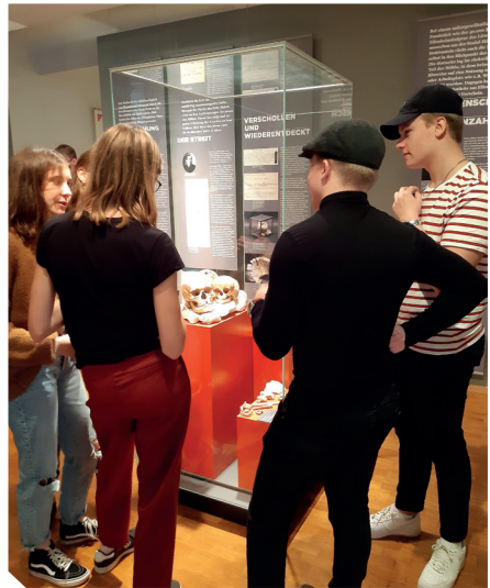
Kaupunginmuseo Ulmer Museumissa