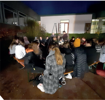
Iltauutiolla makkaran paistoa viimeisenä iltana

Illalla, kun olimme tulleet Ulmista takaisin Leutkirchiin, me menimme saksalaisten kanssa grillaamaan nuotiolla erilaisia grilliherkkuja. Tämä oli vika ilta jolloin näimme saksalaisia. Jouduimme hyvästelemään heidät ja se oli todella haikaa.