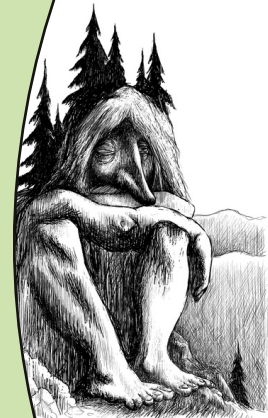
Art by Wikimedia Commons user