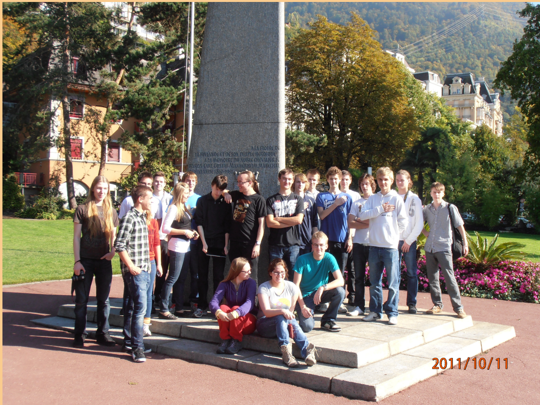
Askolan, Kolarin, Pellon ja Porlammin lukioden tiedeleirikoululaiset Montreaux'ssa Suomen marsalkka Carl Gustaf Emil Mannerheimin muistomerkillä.

Montreaux'sta Genevejärven kierros jatkui kohti Lausannea, jossa määränpäämme oli olympiamuseo. Olympiamuseon edustalla itse kullekin tirahti isänmaallinen kyynel silmäkulmaan, sillä pihaa koristi kansallissankarimme, kaikkien aikojen olympiaurheilija Paavo Nurmen muistopatsas. Kiertelimme olympiamuseossa reilun puolen tunnin ajan. Olympiamuseossa vierailun jälkeen Genevejärven kierroksemme alkoi olla paketissa, ja edessä oli enää paluumatka kohti Geneven nuorisohostellia.