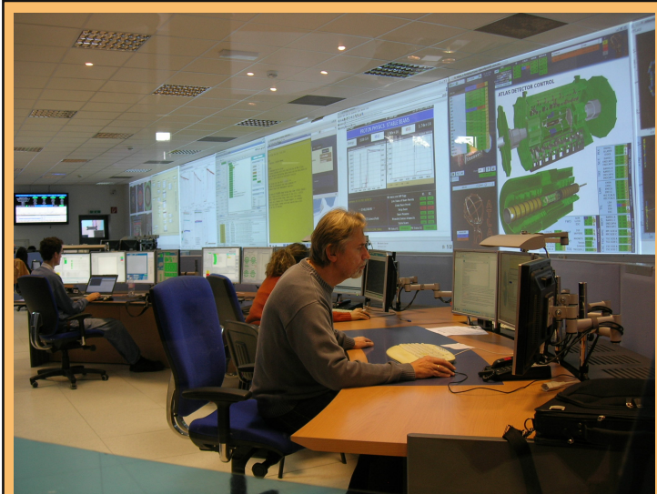
LHC:n ATLAS-koeaseman kontrollihuone.

Pääsimme myös näkemään paikan, jossa antimateriaa valmistetaan. Sen jälkeen olikin vuorossa enää oppaamme pitämä yhteenveto- ja palautekeskustelu vierailusta. Päivää oli kuitenkin vielä jäljellä, joten suuntasimme jälleen Geneveen ja siellä tutustumaan YK:n päämajaan.