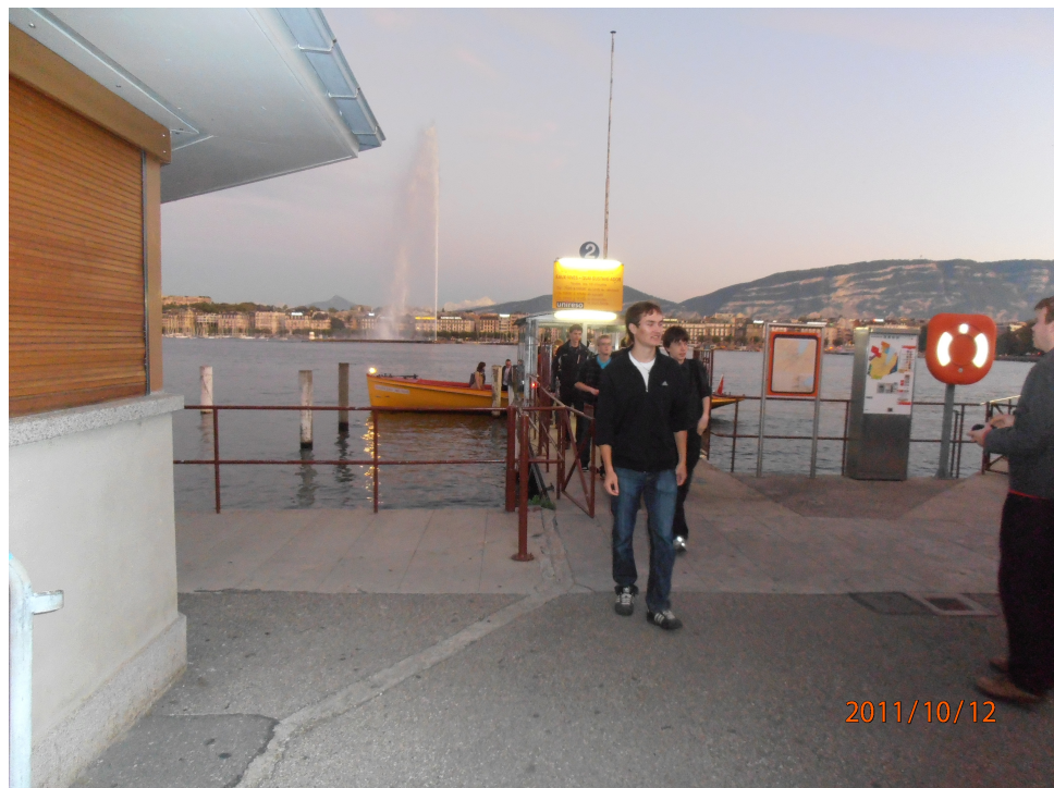
Treasure Huntin viimeinen tehtävä Geneve-järven ylitys venebussilla on suoritettu. Karrin joukkue maalissa väsyneenä, mutta onnellisena.

Kuvat ja teksti Ilari Kalliojärvi ja Kalle Lampinen