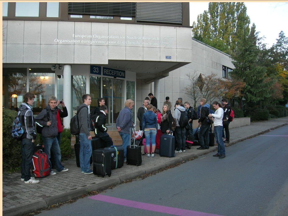
Saavuimme varhain keskiviikkoamuna 12.10.2011 Cerniin raitiotievaunulla. Kuvassa tiedeleirikoululaiset odottavat pääsyä respaan, josta saimme kulkuluvat Cernin alueelle.

Aamu alkoi jo varhain hostelliin aamupalalla, ja siitä lähdimme vielä aamuhämärissä bussilla koko päivän kestäväälle turistikiertokierrokselle. Ensimmäinen pysähtyminen oli Ranskan puolella Chamonix'ssa, josta nousimme gondoli hissillä ylös Aiguille du Midille 3842 metrin korkeuteen asti. Sieltä näimme vieressä sijaitsevan Mont Blancin huipun ja ympäröiviä Alppeja.