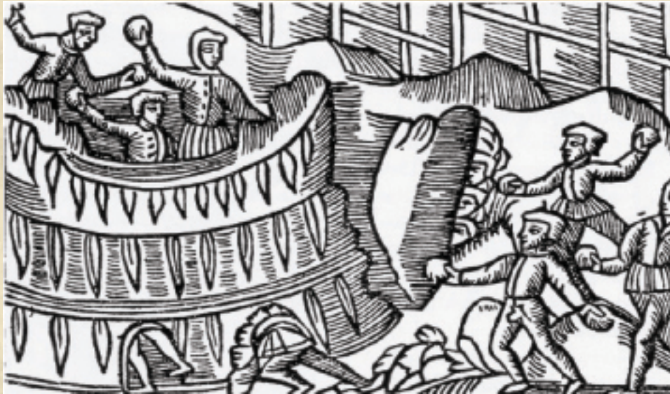
Piirros Olaus Magnuksen kirjasta Pohjoisten kansojen historia.

Lapset ovat leikkineet aina, niin myös keskiajalla. Monet leikit olivat samantyyppisiä kuin nykyisinkin. Erilaisia pallopelejä pelattiin, samoin myös lautapelejä. Arpanappuloilla leikittiin ja pajupilleillä soitettiin. Niin ikään savukoilla on vihellely jo keskiajalla. Talvella leikittiin mm. lumisotaa ja rakennettiin lumilinnoja. Lapset eivät leikkineet vain hovin vuoksi, vaan leikkien tarkoituksena oli valmentaa heitä aikuisten maailmaan. Tunnettu ruotsalainen historioitsija Olaus Magnus kuvaa keskiaikaista lumisotaa teoksessaan Pohjoisten kansojen historia. Teoksesta selviää, että lumisotaa leikkimällä ja lumilinnoja rakentamalla harjoitettiin nuorukaisia erilaisiin sodan vaatimiin taitoihin, kuten linnoitusten valtaamiseen.