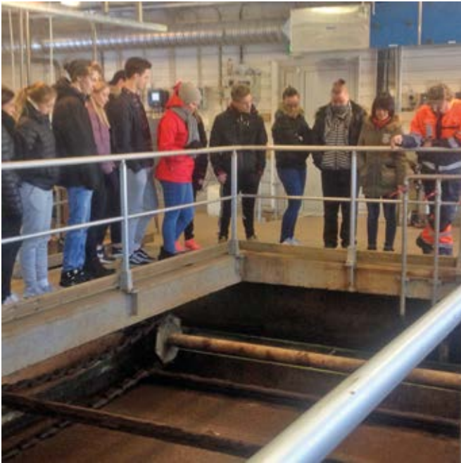
Alkajia ähtärin jäteveden puhdistamolla (kurssi B12).