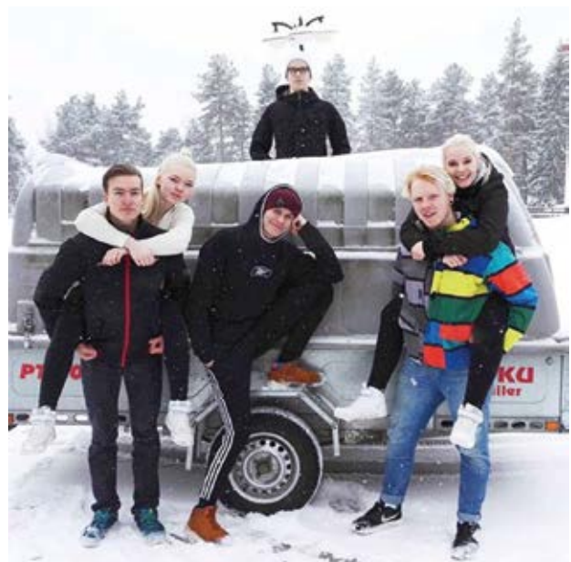
Hallituksen sohvot piilossa kuomun alla.