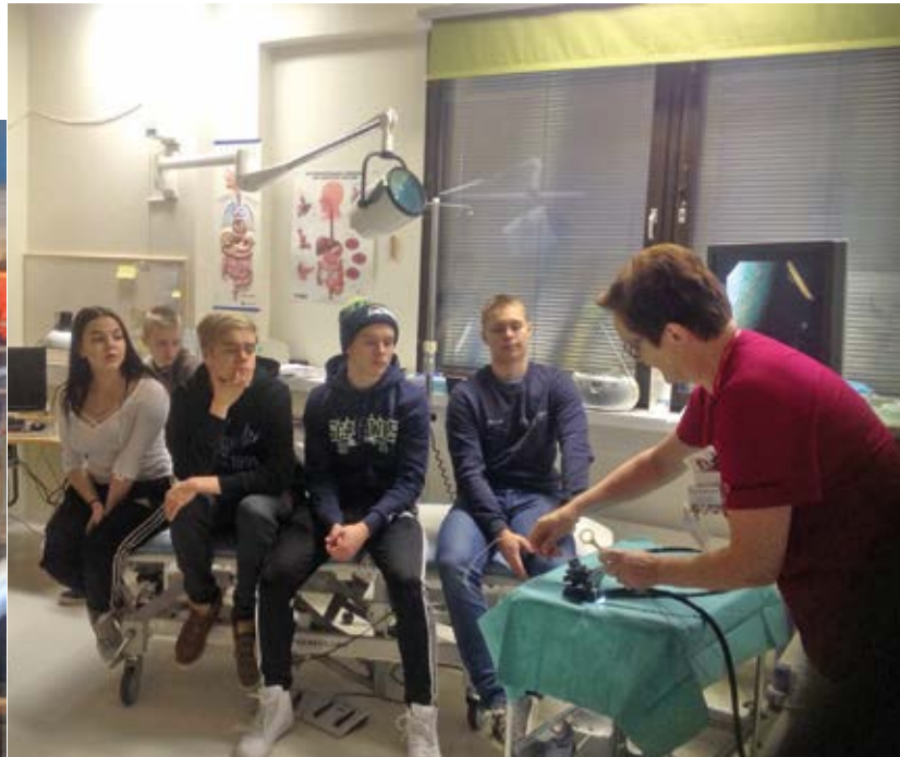
Endoskopiaan perehdytys Kuusiolinnan poliklinikalla (kurssi B14).