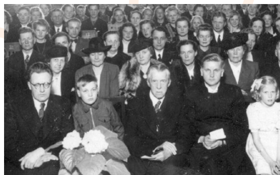
Otsolan avajaiset Porissa 29.4.1945